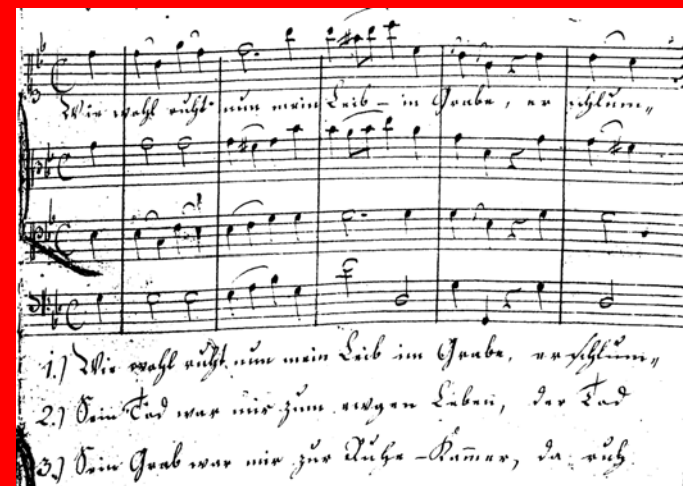
Handschrift Johann Michael Bachs aus der Forschungsbibliothek Gotha: Mus. 66/1

Unter dem Motto „Arm und Reich“ präsentiert das junge Ensemble consart den „150. Psalm“ von Johannes Steuerlein (Wasungen-Breitungen-Meiningen), die Kantate „Brich dem Hungrigen dein Brot“ BWV 39 von Johann Sebastian Bach (Eisenach), Werke von Johann Michael Bach (Schmalkalden-Tann) u.a.