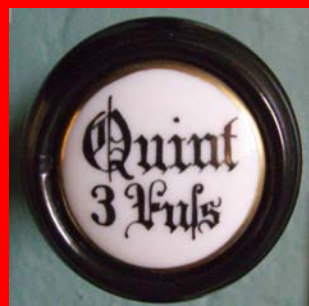
Registerzug der Lahrbacher Orgel

Kutschfahrten auf Voranmeldung unter Tel: 06682 / 213.